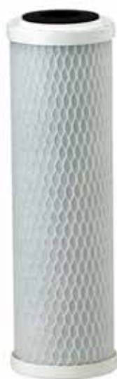
CG53-10 Cartucho de Reemplazo: EV9108-53